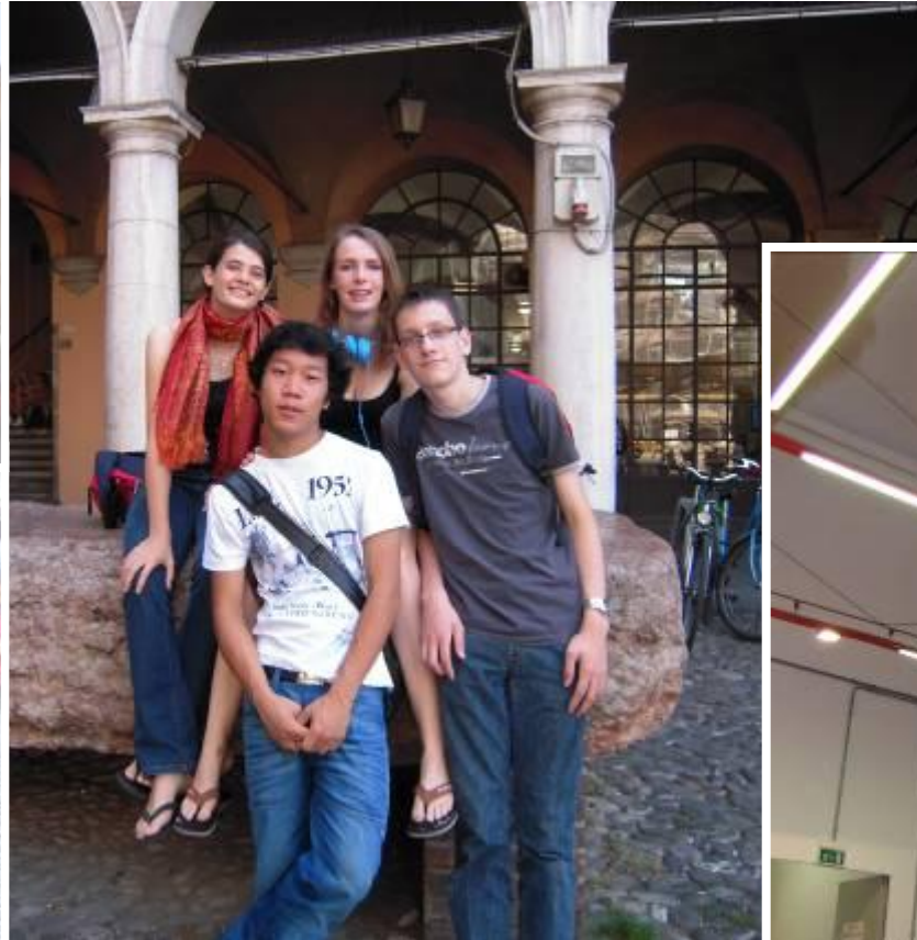
Sur la dalle en rosso ammonitico où ils ont tant souffert