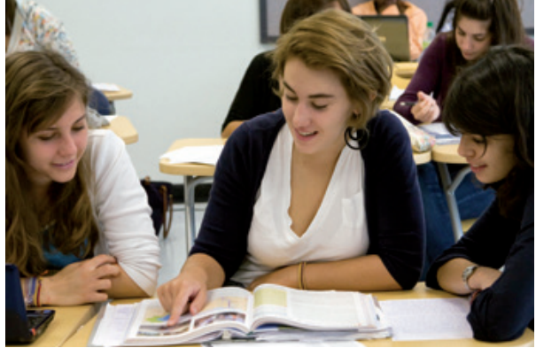
المدرسة الفرنسية الدولية روشوميو بواشنطن AEFÉ ©

من بينهم 3 691 في المؤسسات المدارة بشكل مباشر