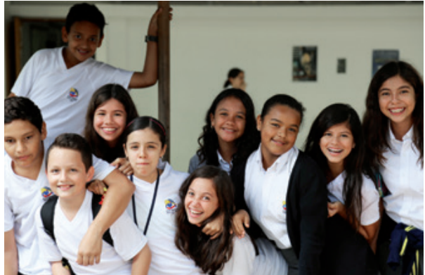
المدرسة الفرنسية بول-خاليري بكاى AEFÉ ©

يوم تدريب في إطار برنامج التدريب الإقليمي