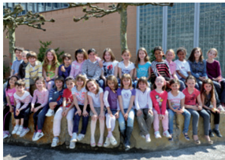
Escuela francesa de Saarbrücken y Dillingen, Alemania

Conceder BECAS ESCOLARES , en función de los recursos, a los niños de nacionalidad francesa escolarizados en los colegios de la red.