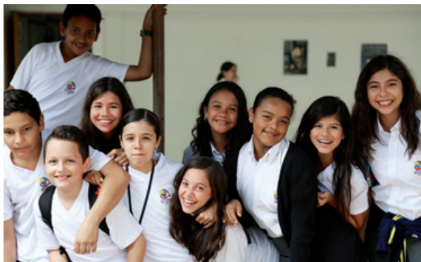
Liceo francés Paul Valéry de Cali, Colombia

Este dispositivo está reservado a los alumnos franceses a partir de los 3 años de edad, inscritos en el registro mundial de franceses radicados fuera de Francia y escolarizados en un centro de enseñanza francesa.