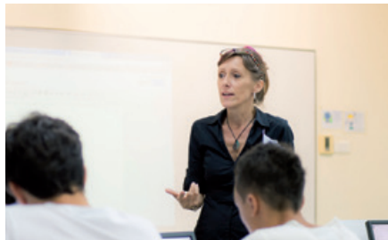
Французский лицей в Сингапуре

Подготовить учащихся к УСПЕШНОЙ ПРОФЕССИОНАЛЬНОЙ ДЕЯТЕЛЬНОСТИ .