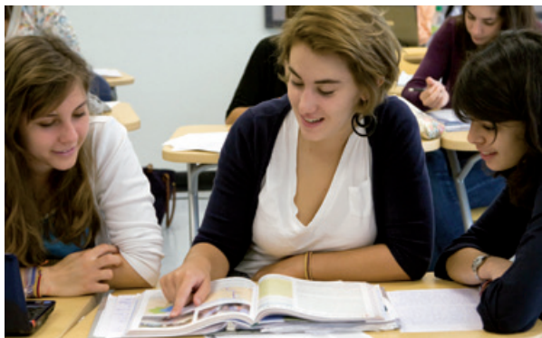
Французский международный лицей имени Рошамбо в Вашингтоне

Общий бюджет учебных заведений, входящих в систему AEFE, составил в 2015 году 1 278 000 евро. Он составлен по принципу софинансирования: с одной стороны – оплата расходов на образование учащимися, с другой – субсидии Министерства иностранных дел и международного развития. Франция – единственная в мире страна, имеющая столь развитую систему образования за рубежом, финансируемую большей частью из государственного бюджета.