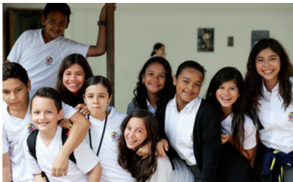
Французский лицей имени Паля Валери в Кали

Семьям с невысоким уровнем доходов выделяются пособия на образование детей. Они предназначены учащимся, имеющим французское гражданство, в возрасте не менее 3 лет, зарегистрированным в реестре французских граждан, проживающих за рубежом, и обучающимся в учебном заведении системы французского образования.