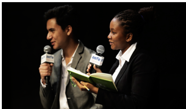
Final de la 6ª edición de Embajadores en ciernes 2018, Théâtre Paris-Villette, los días 3 y 4 de mayo de 2018.

de franceses en el extranjero (en 15 circunscripciones)