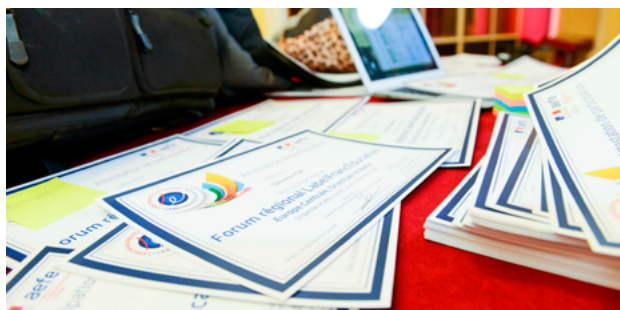
Foro regional LabelFrancÉducation - Europa central, oriental y báltica en Sibiu, Rumania

Por otra parte, la AEFÉ garantiza la puesta a disposición de numerosos recursos pedagógicos y servicios por el conjunto de los actores y colaboradores del dispositivo (Instituto francés, CIEP, TV5Monde, etc.).