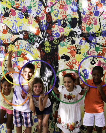
Instituto francés Montaigne, Cotonú, Benín