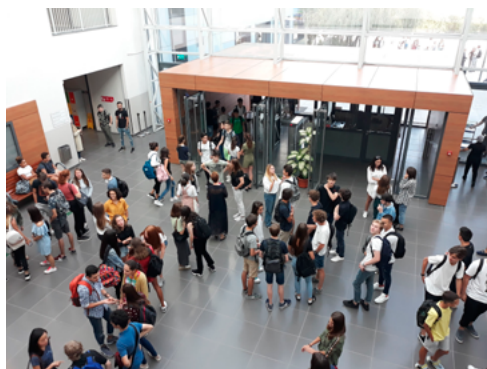
Instituto francés Anna de Noailles, Bucarest, Rumania

100 % de los exámenes corregidos por vía digital