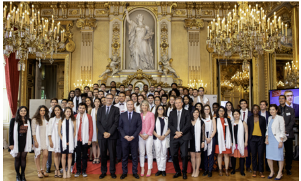
Ceremonia de graduación de los becarios Excellence-Major en el Quai d'Orsay, París

Dirigido por la AEFÉ, que confió la gestión administrativa a Campus Francia, este programa permite apoyar a 860 estudiantes de nacionalidad extranjera durante cinco años de estudios en Francia en ramas de excelencia. Una vez seleccionados por una comisión de expertos, los nuevos becarios se benefician de una acogida y de un seguimiento personalizados realizados por el servicio orientación y enseñanza superior de la AEFÉ. Este programa, creado en 1992, tiene cada vez más éxito. Desempeña un importante papel en la política de atracción de la enseñanza superior francesa ante los alumnos extranjeros y contribuye a la diplomacia de influencia de Francia.