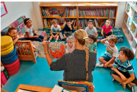
Instituto francés Victor-Hugo, Marrakech, Marruecos