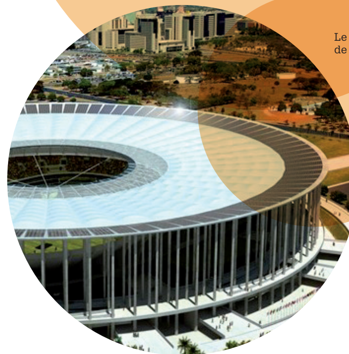
Le stade de Brasilia

Dimanche 15 juin > Matchs de gala et départ