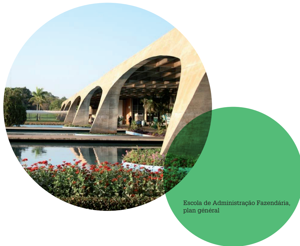
Escola de Administração Fazendária, plan général