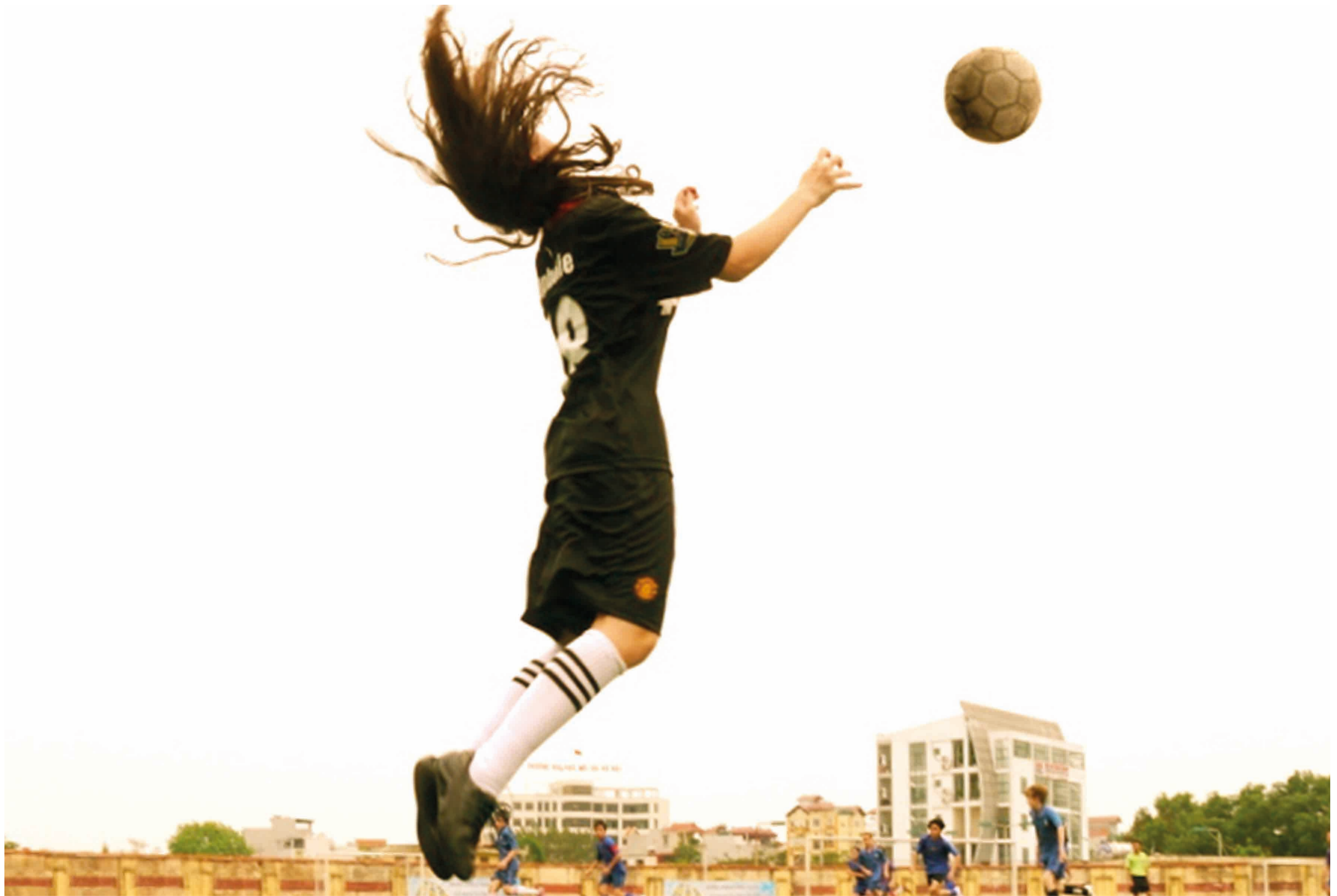
© San Yvin (élève de 1 re )