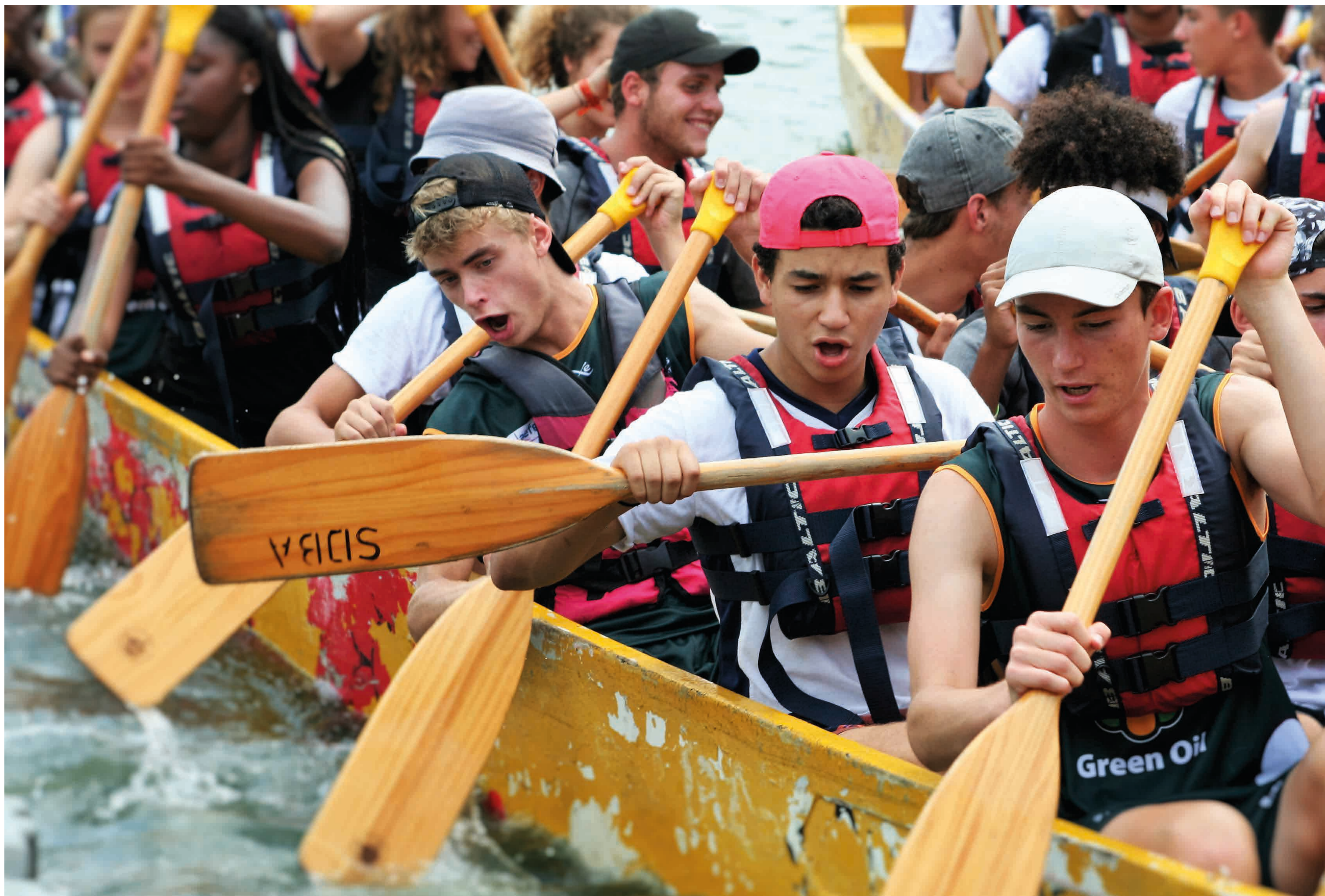
© Antonia Terrizano (élève de 1 re )