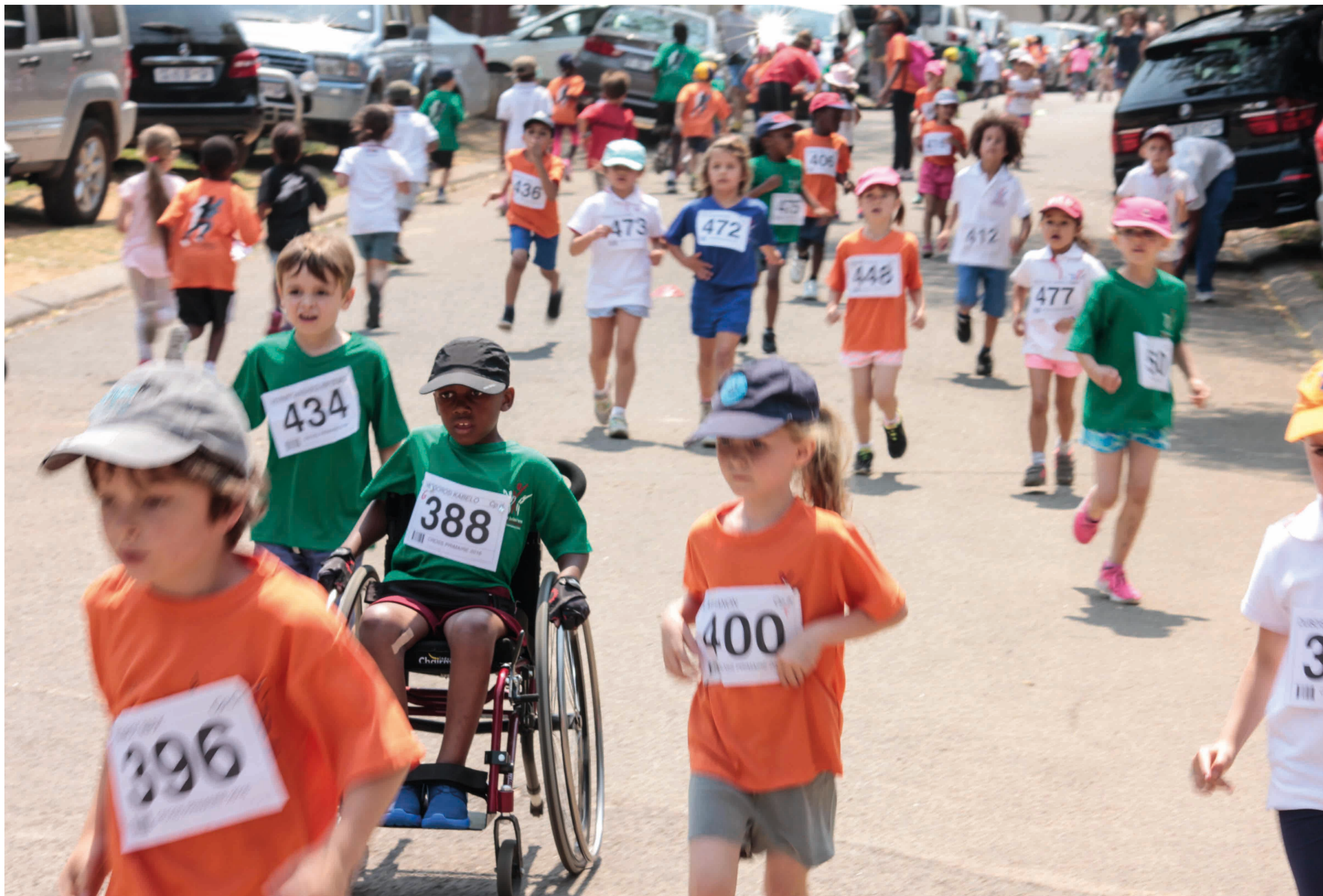
© Lycée français Jules-Verne de Johannesburg