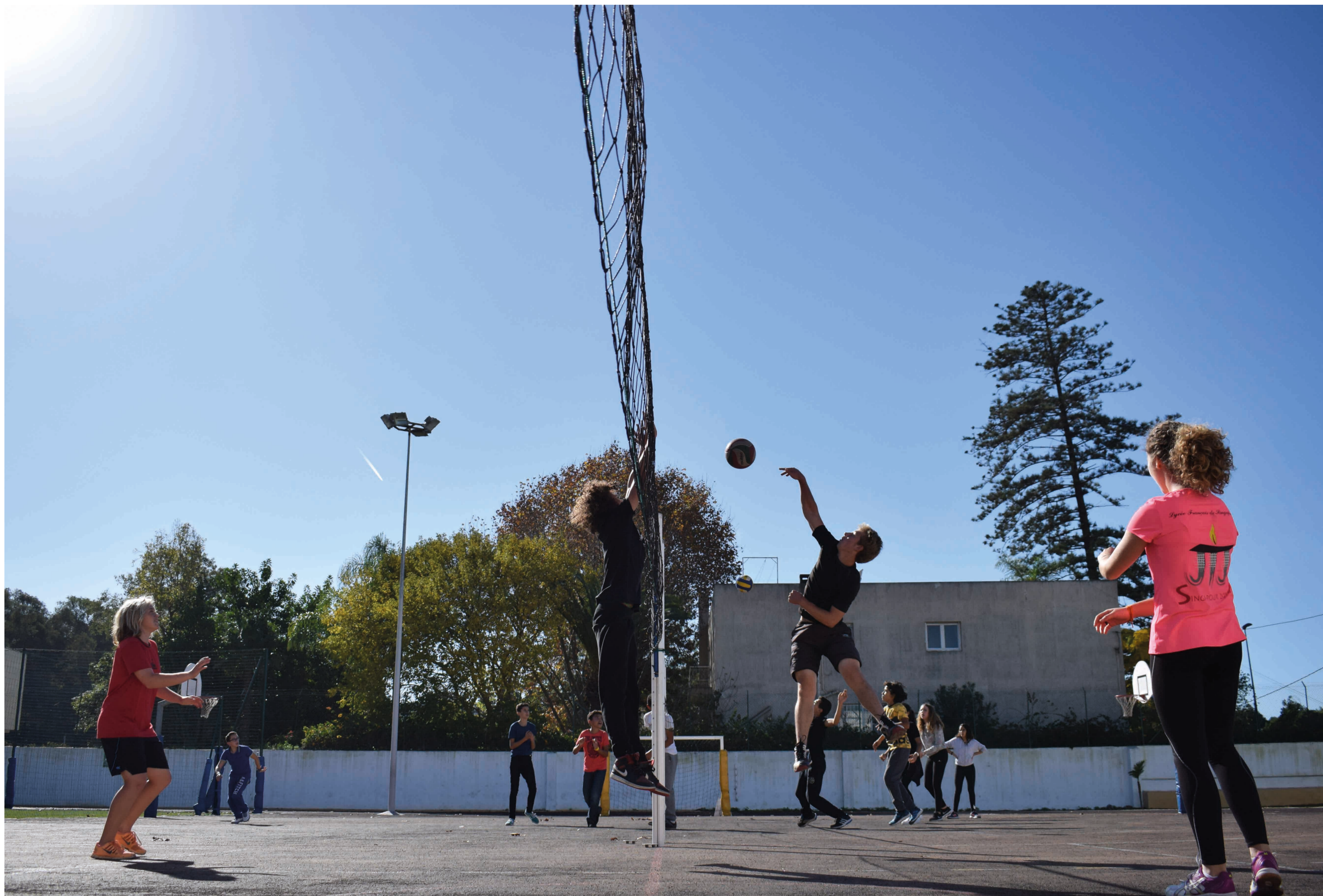
© Yasmine Bouziri (élève de 1 re )