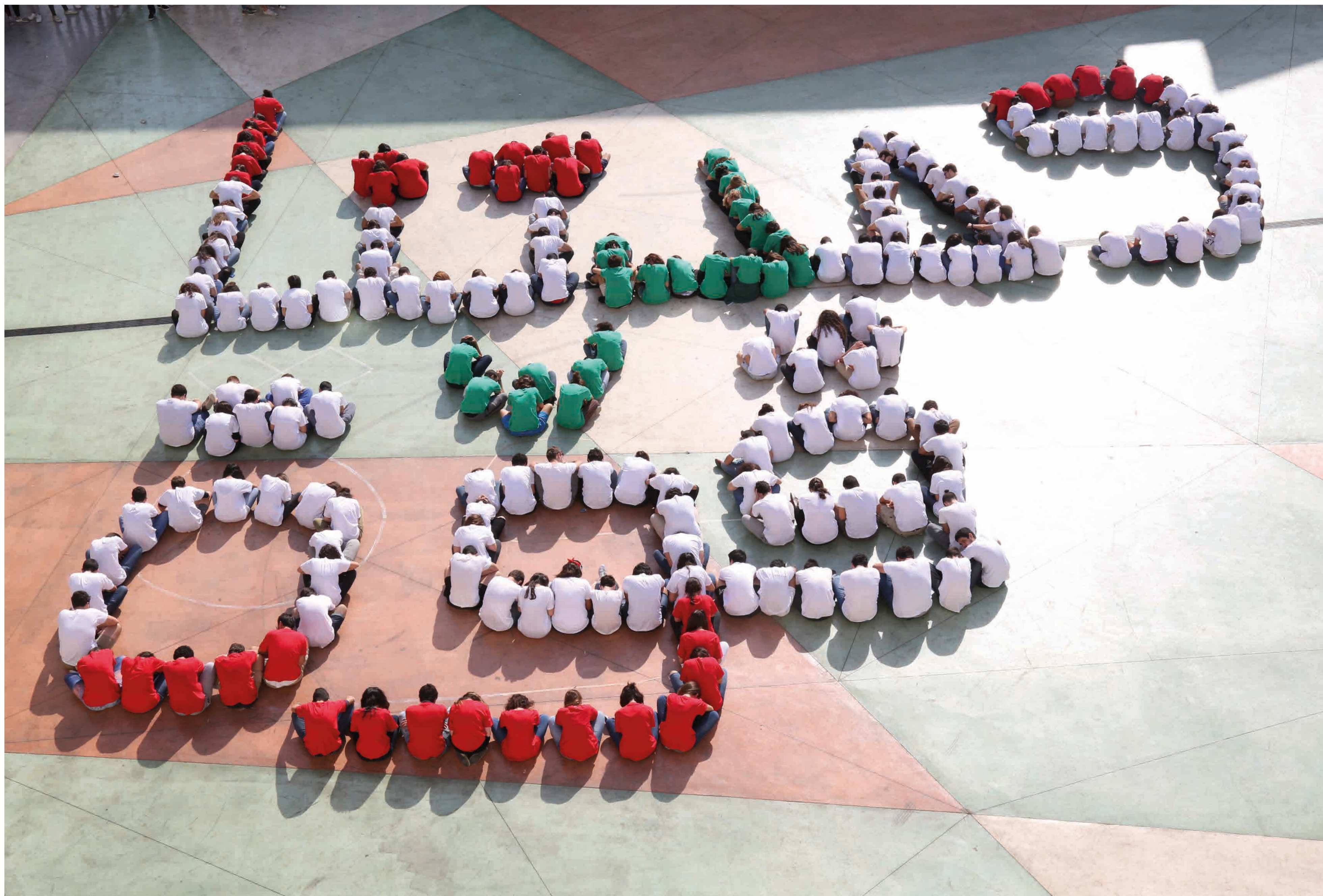
© Jules Badarani (élève de terminale)