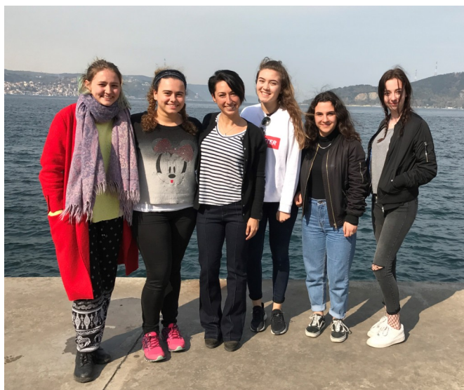
Mme Panahzat et les auteures