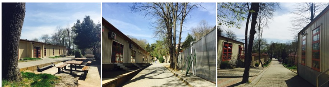
La voie centrale du Lycée

Le Lycée Français Pierre Loti compte 1346 élèves répartis de la maternelle à la Terminale ( www.pierreloti.k12.tr ). La ville d'Istanbul compte, elle, 14.804.116 habitants (2016). C'est la « capitale » économique de la République de Turquie (783 562 km 2 et 79.814.871 habitants - 2016), dont la capitale politique est Ankara.