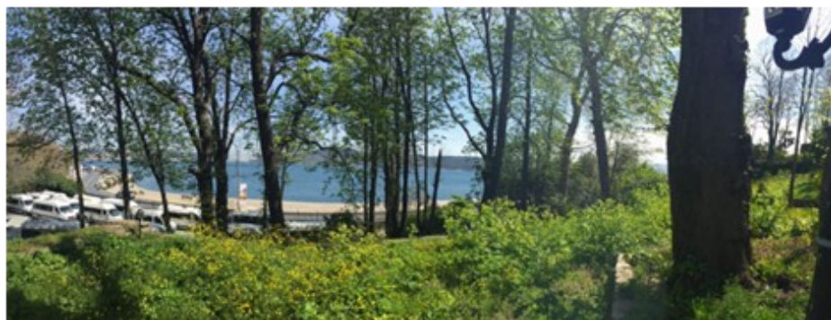
Vue sur le Bosphore depuis le haut du lycée