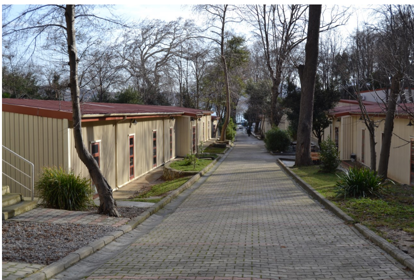
La voie centrale du Lycée

Age moyen et nombre d'élèves : 15-16 ans et 22 élèves